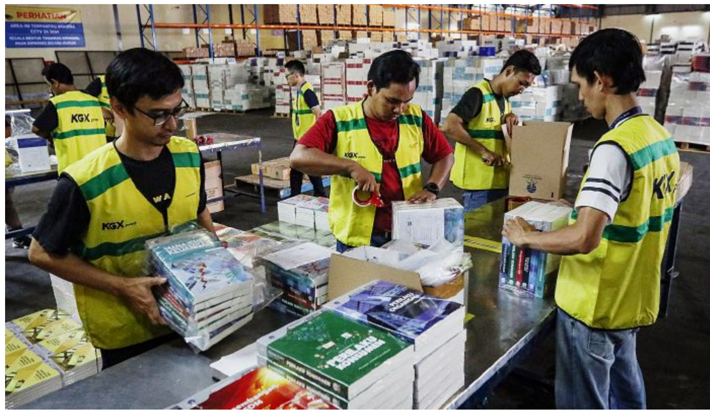
ADRYAN YOGA PARAMADHYA

Para pekerja mengemas bahan ajar cetak Universitas Terbuka di gudang Gramedia, Cilincing, Jakarta Utara, Senin (20/3/2023).